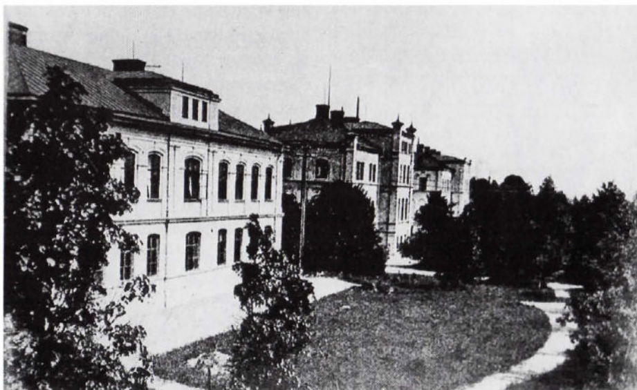
Örebroskolan på Sturegatan 1-3

Betyg i de olika ämnena fick barnen varje år och betyg i ordning och uppförande fanns också och det var viktigt att få bra betyg i dem. Det var noga med att läroböckerna som fanns i bänken låg