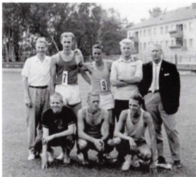
Berra som ledare för IK Scania friidrott vid SM i Jönköping 1966