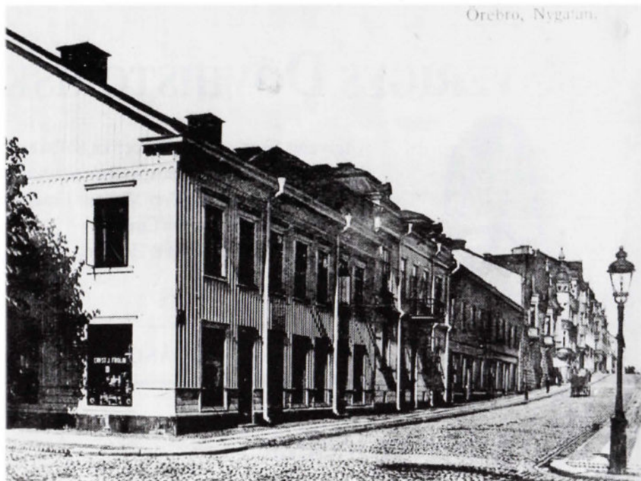
Döfstumskolan på Nygatan 1875-1877

En kort tid efter intagningen upptäckte man att det inte fungerade bra i skolarbetet utan att man fick dela eleverna i två grupper dels på grund av elevernas olika ålder och dels deras olika begåvningar.