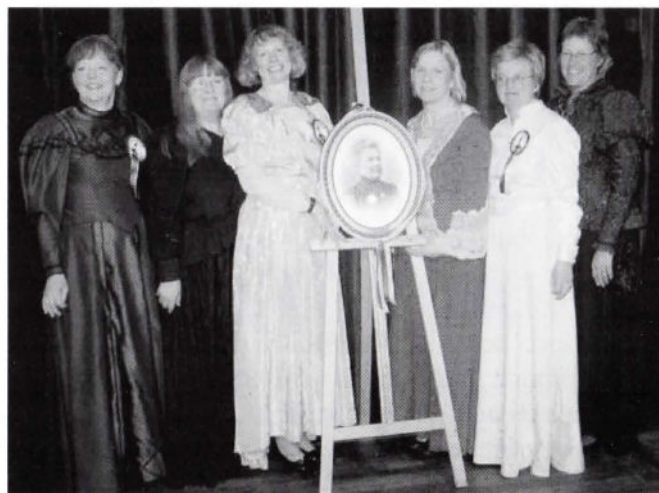
Kvinnoföreningens styrelse bar tidstypiska kläder dagen till ära