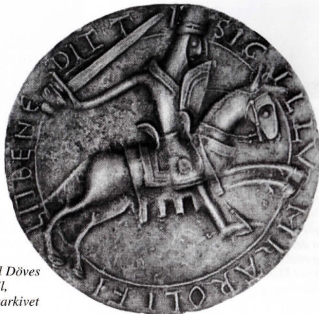
Karl Döves sigill, Riksarkivet