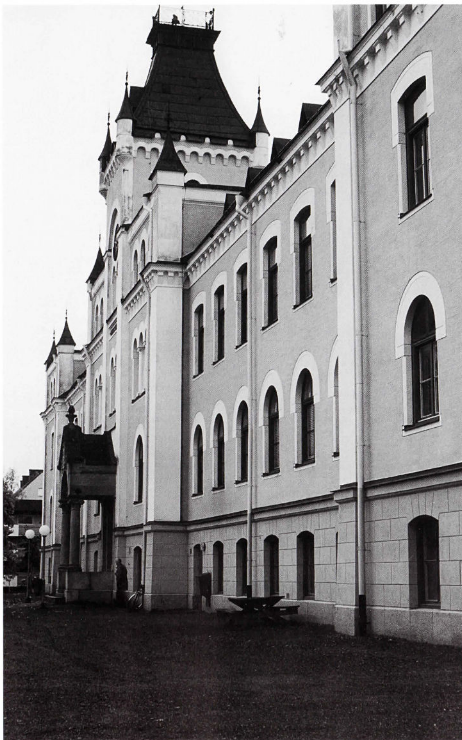
Den pampiga skolbyggnaden vid Södra vägen som blev klar 1896.

nivåer att ta hand om. Varför vi har tecken- och hörselklass beror på att en person med hörselskada/förlorad hörsel ska lättare få möjlighet få prova sin skolgång. Först har många gått i vanlig skola. Det fungerade inte att därefter flytta till Härnösand. Till hörselklassen sedan blivit nyfiken av teckenspråk, som till sist flyttat till teckenklass. Det finns även elever som har gått från teckenklass till hörselklass. Fördelen med arbetslag är att man kan variera eleverna efter ålder och kunskap ty varje individ utvecklas olika.