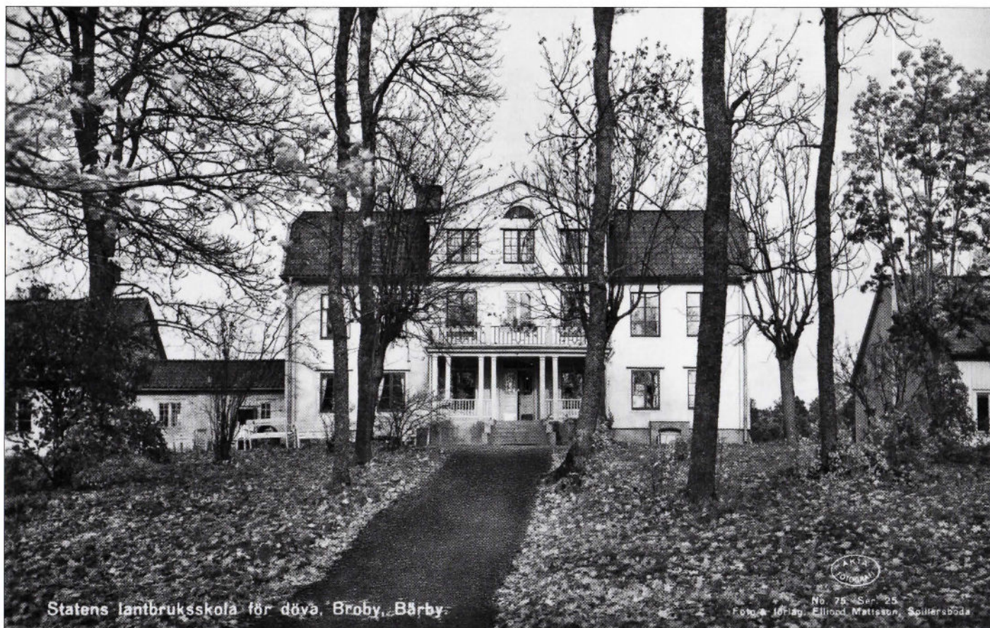
Statens lantbruksskola för döva, Broby, Bärby.

No. 75 - Ser. 25