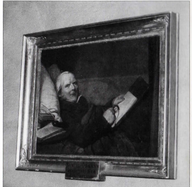
Samuel Ödmann (1750-1829).