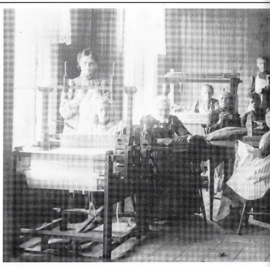
Dövskolan, Hjorted före 1906, Robin Holmstedts samlingar.