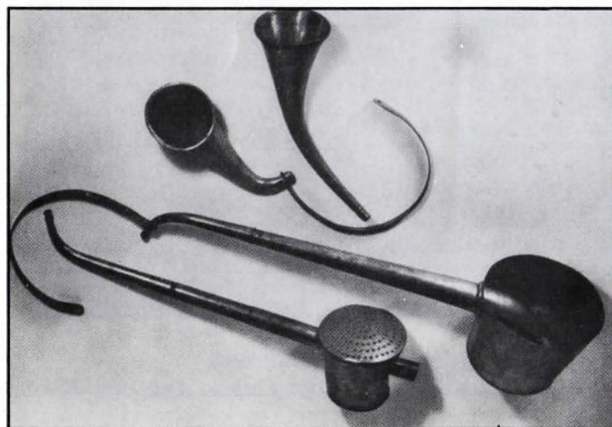
Beethovens hörapparater under åren 1812-1814

Den ökande dövheten gjorde att han förlorade allt mer