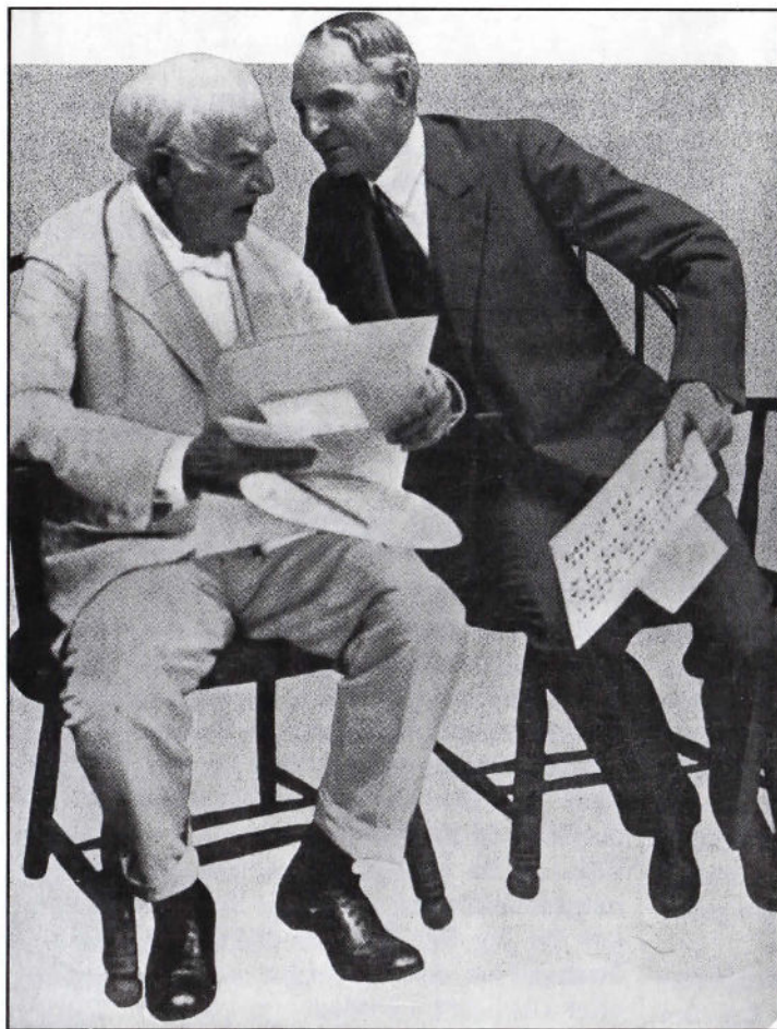
Henry Ford samtalar med Thomas Edison. Från boken Natur och Kultur .

Edison började läsa mycket tidigt och utförde den del experiment i hemmets källare. Vid 12 års ålder började han arbeta som tidningspojke på järnvägen mellan Port Huron och Detroit. Varenda slant han tjänade gick till böcker och kemikalier.